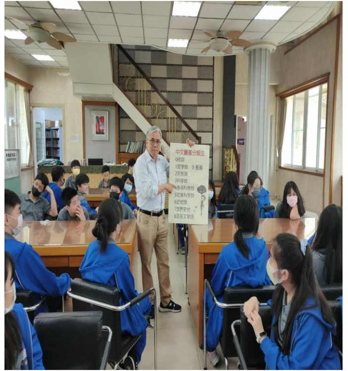
圖書館利用教育台灣學書籍查閱說明