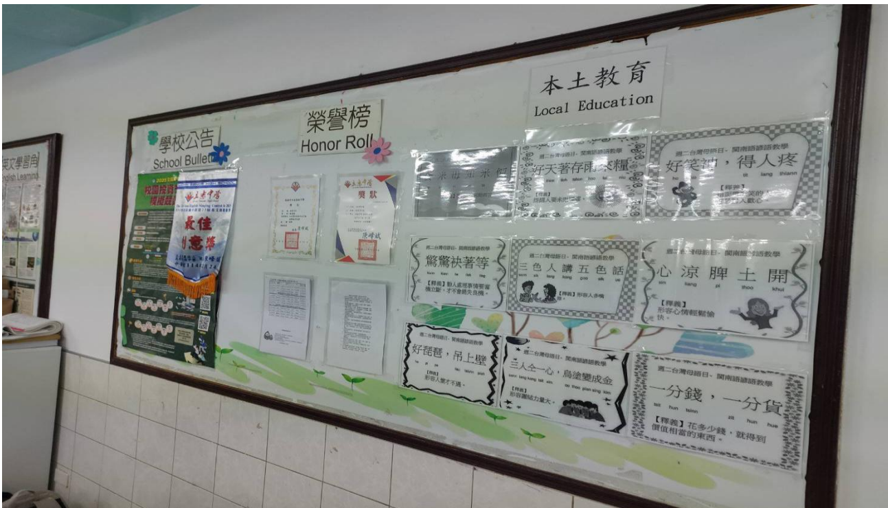
班級本土語學習區