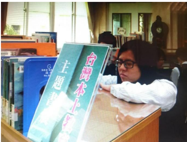
圖書館設有台灣學專區