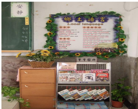
「行動圖書館」以主動及時、效率，送書到教室，借閱便捷。