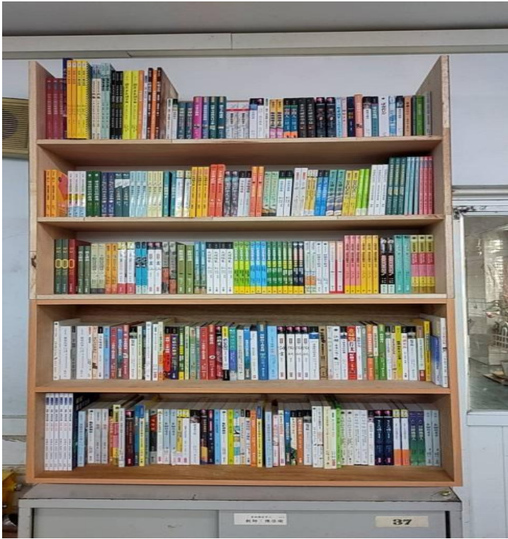
「行動圖書館」放置台灣學書籍