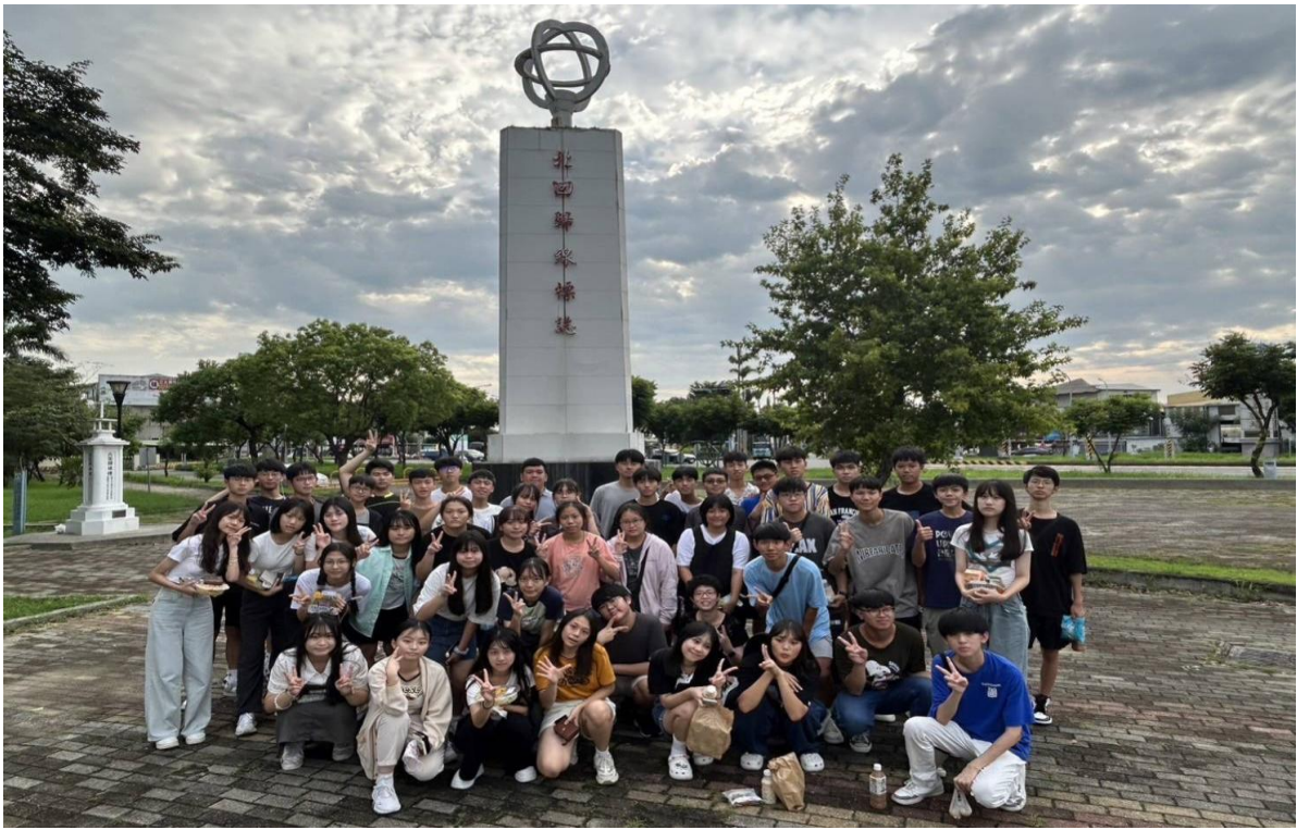
北回歸線踏查—學生家長同行探尋本土歷史、文化與美學 (114. 09. 06)